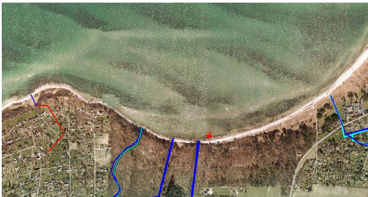
Fig. 3. Der er en del registrerede udløb i nærheden. Blå = åbent vandløb, rød = dræn.