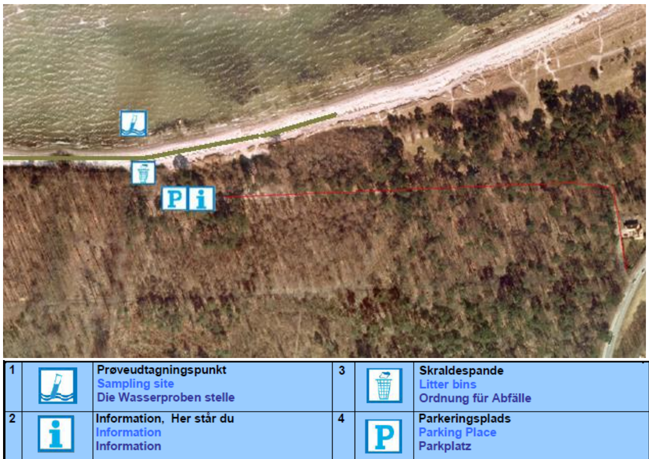
Fig. 1. Oversigtskort over Høve strand, med information om diverse faciliteter.

Badestedet er beliggende i den nordlige del af Asnæs. Her findes en fin sandstrand med spredte bælder af store sten og strandens udstrækning fremgår af kortet nedenfor (Fig. 1). Stranden er ca. 700 meter lang og består af et område af sand/sten der er ca. 15 meter bredt. Der er, ved prøvetagningsstedet, ca. 14 m ud til ½ meters dybde, 27 m til én meters dybde og 375 meter til 2 meters dybde (aflæst på søkort).