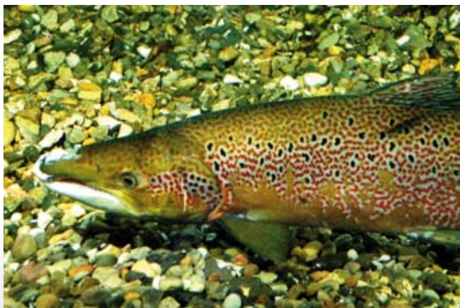
Varierede fysiske forhold i vandløbet, som forskellige dybder og vandhastighed, er med til at skabe gode levesteder for bl.a. Laks.