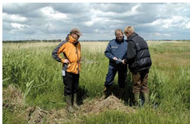
Landmanden tager en snak med sin rådgiver.

Læs mere om de forskellige tilskudsordninger her: Naturstyrelsens hjemmeside: www.naturstyrelsen.dk FødevarerErhvervs hjemmeside: www.ferv.fvm.dk Plantedirektoratets hjemmeside: www.pdir.fvm.dk Eller på LandbrugsInfo: www.landbrugsinfo.dk