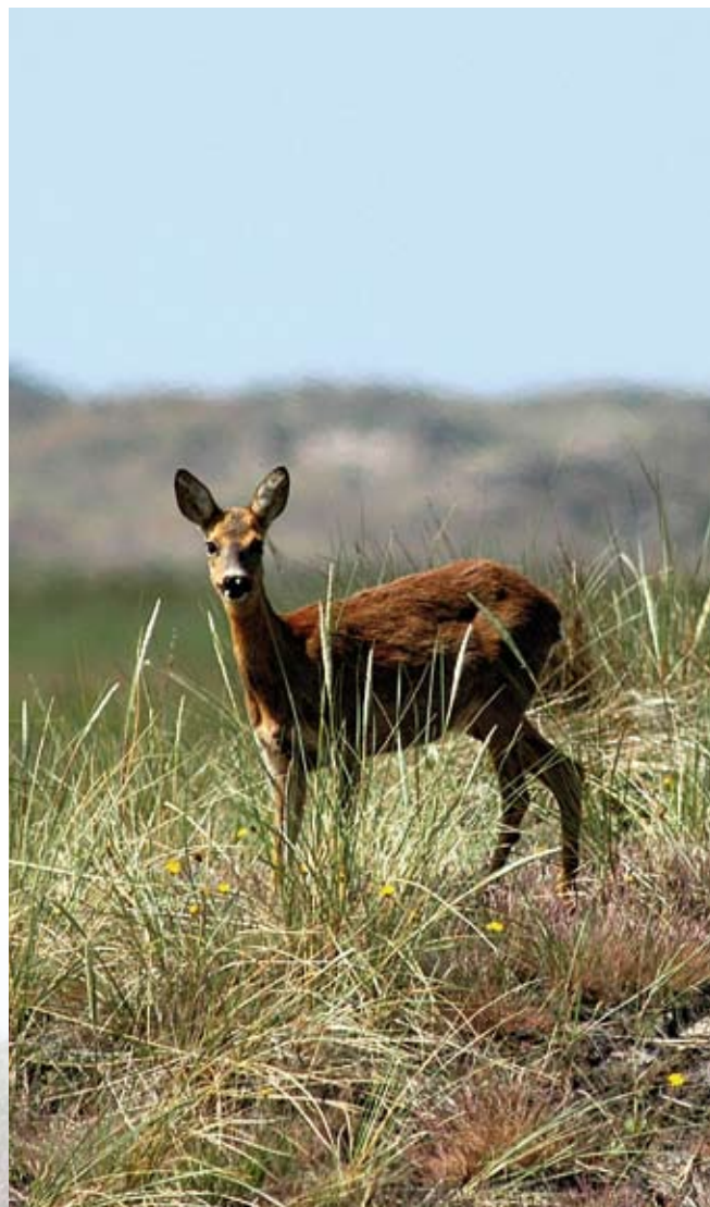
Rådyr og kron dyr finder også føde på heden.