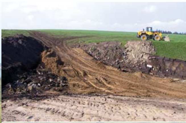
Det vil tage mange år og en stor indsats at genskabe dette ødelagte overdrev.

For landmanden gav det meget ekstra arbejde, der kunne være undgået, hvis han forinden havde kontaktet kommunen og hørt, om der kunne være problemer med at opbevare materialet på arealet. For naturen vil det tage mange år, før plantedækket er gendannet, og planterne igen kan vokse på arealet.