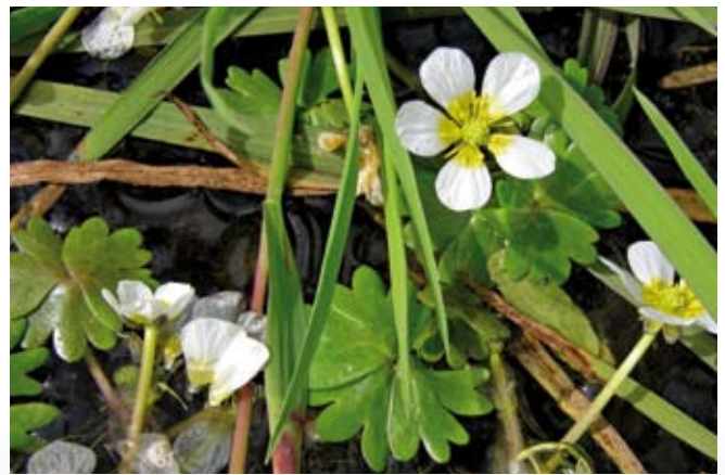
Vandranunkel kendetegner det rene vand.

De § 3-beskyttede vandløb er udpegede og fremgår alle af Miljøportalen www.arealinfo.dk . De fleste § 3-vandløb er naturlige vandløb, men de kan godt være regulerede. Langs de naturlige og højt målsatte vandløb skal der være en 2 meter-bræmme på begge sider af vandløbet. Bræmmen regnes fra vandløbets øverste kant.