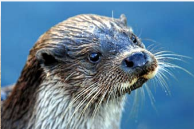
Odderen lever ved uforstyrrede vandløb med gode muligheder for at skjule sig i vegetationen.