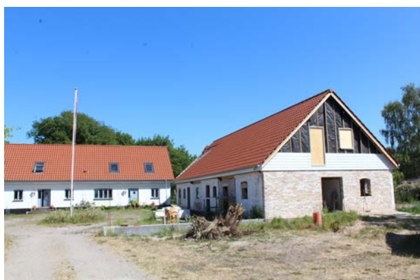
De gamle mursten bliver brugt til at bygge et nyt byggeri på samme sted i Veddinge.