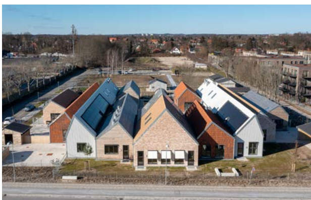
En cirkulær bygning, bygget med materialer fra en nedrivning på samme sted. Bygherre Gladsaxe Kommune.