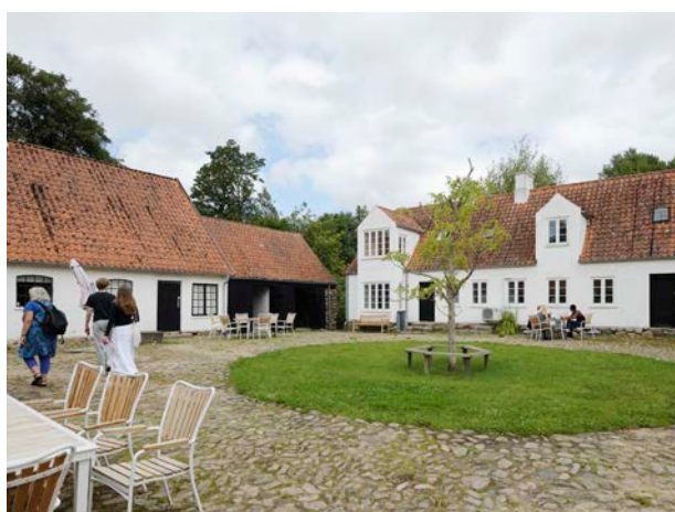
Gårdrum i Museum Malergården i Plejerup.