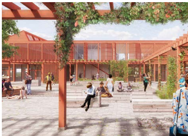
Visualisering af den nye campus Odsherred i Asnæs af tegnestuen Vandkunsten.

Overflader og materialer påvirker vores ubevidste og bevidste forståelse af det byggede miljø. Derfor er det vigtigt at tænke på sanseligheden og detaljerne i arkitekturen, og at materialer og bygningens funktioner er lette af aflæse, så vi, som mennesker, kan forstå og være trygge i de byrum, vi er i.