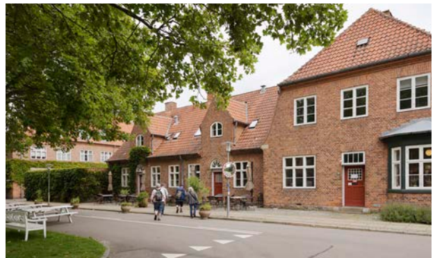
Annebergpark kulturmiljø, i bedre byggeskik stil. Bygninger indenfor området er bevaringsværdige eller fredede.