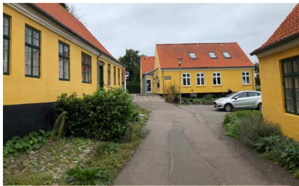
Det nyere hus i Nykøbings gamle bymidte (i baggrunden) er tilpasset områdets særlige identitet.

Målsætning: Nybyggeri skal forholde sig til steders særlige identitet og respektere historiske miljøer