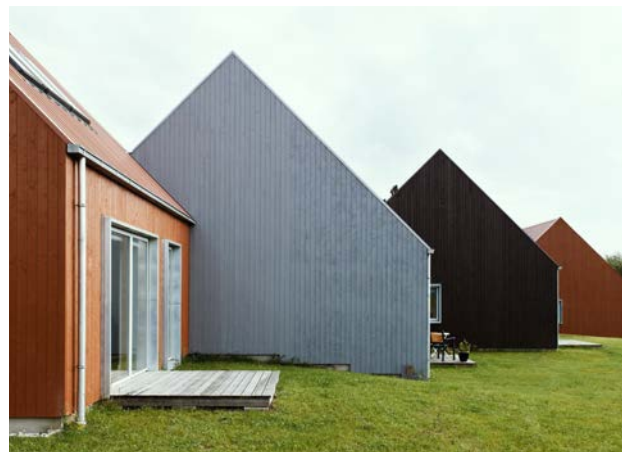
Nogle gange kan små og simple greb, skabe en mere blandet oplevelse af et boligområde. I andelssamfundet Hjortshøj, har man lavet et simpelt farveskift på de enkelte boliger, for at skabe større genkendelighed i arkitekturen.

Blandede byer fremmer social mobilitet, hvilket i fremtiden kan øge velstanden i samfundet 9