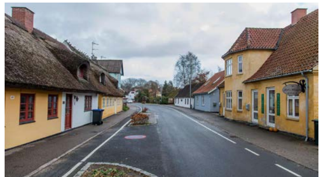
Slynget landsbygade i Højby med gamle gård- og længehuse samt nyere villaer, som er tilpasset landskabet