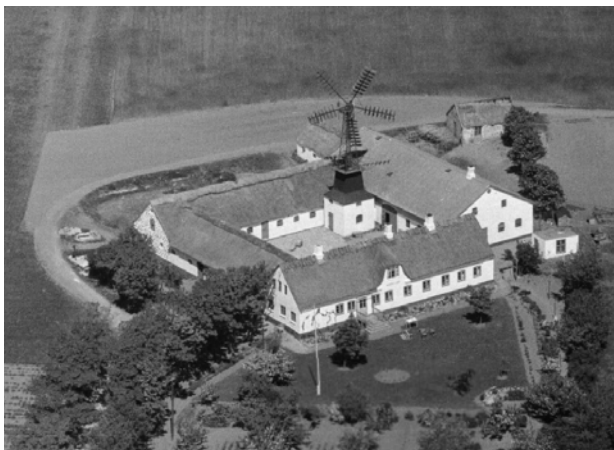
Firelænget gård på Sjællands Odde opført i 1874. Luftfoto fra 1948.

Du kan bestille tid til et telefonopkald på odsherred.dk/bestiltid