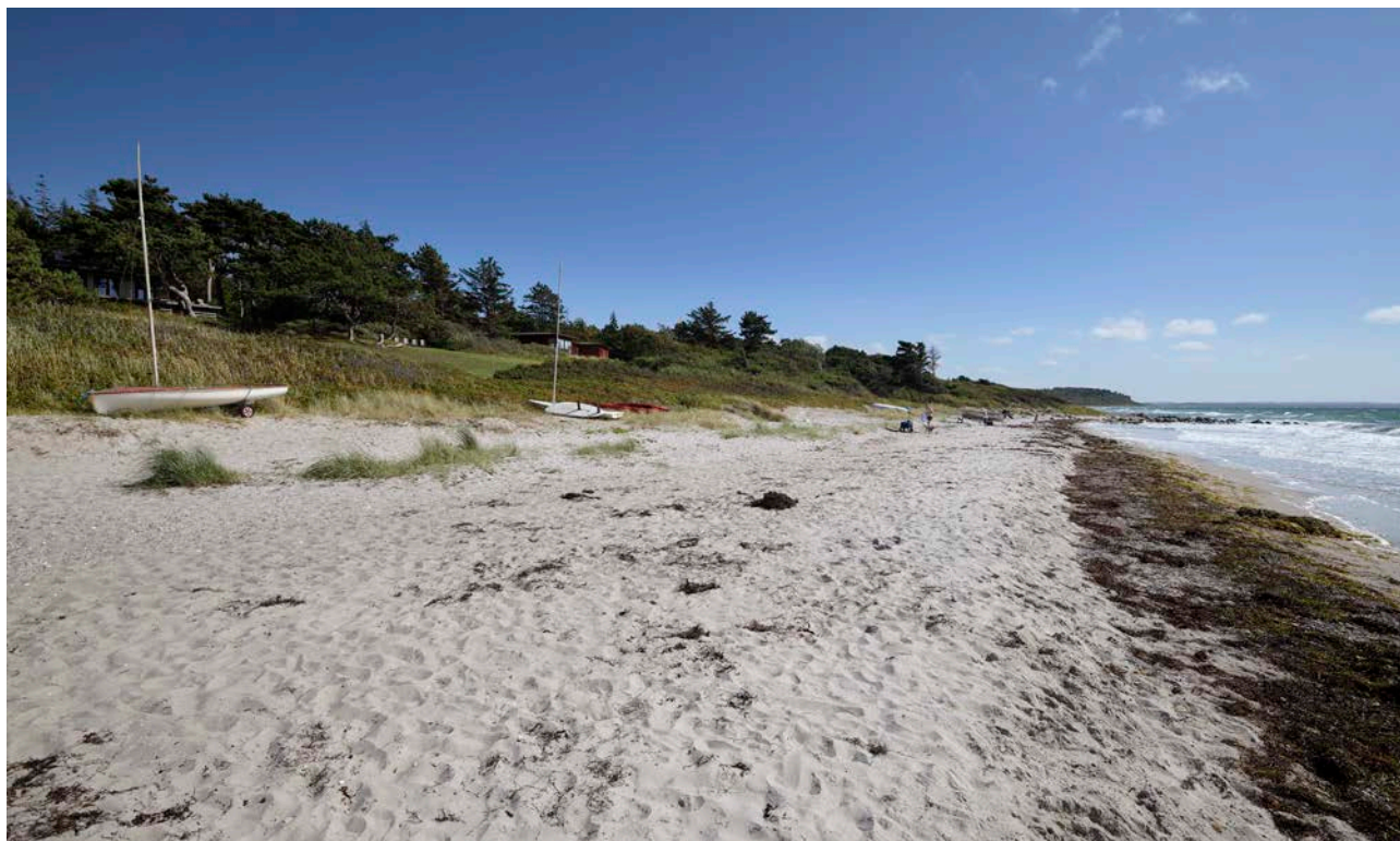
Ordrup strand mod Ordrup Næs.