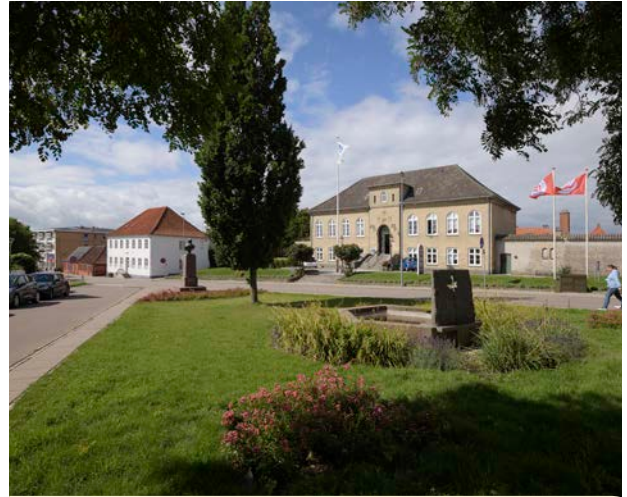
Det gamle bymidte i Nykøbing har ikke mange opholdsmuligheder.

Det er vigtigt at give folk noget 'at komme efter', da mennesker tiltrækker mennesker. Udgangspunktet for at skabe et levende byrum er derfor at give det funktioner, som tiltrækker.