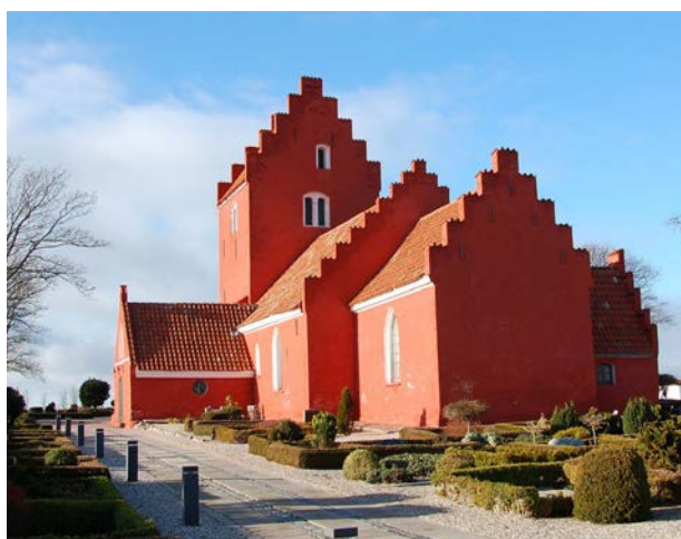
Den røde kirke på Sjællands Odde fra omkring 1300 fremstår stadig smukt med en kalket overflade,