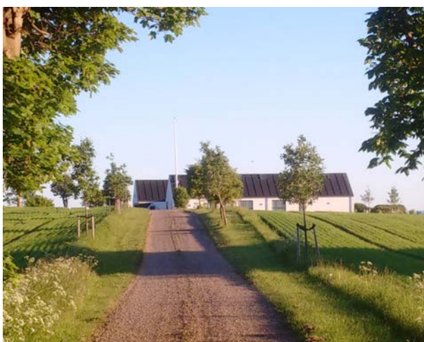
Hus på Sjællands Odde fra 2011, har i den hvide farvesætning og strukturen som trelænget gård, refereret til Odsherreds kulturhistorie, men er samtidig et helt moderne hus.