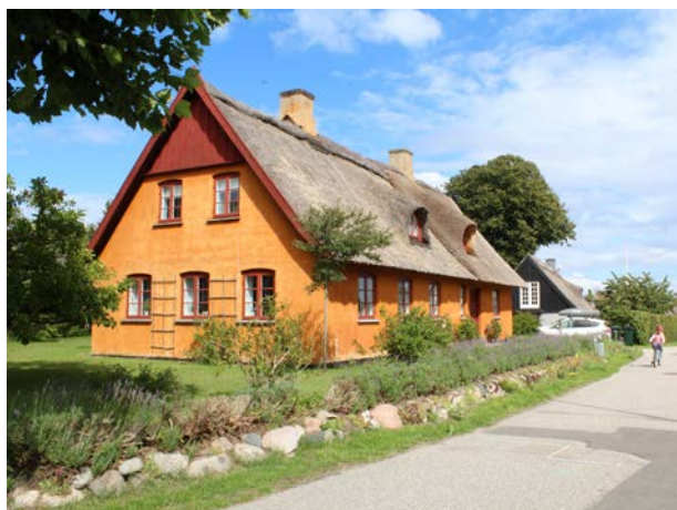
Huset i den gamle bymidte i Rørvig står kalke, hvilket giver det et levende udtryk og gør at huset kan ånde.