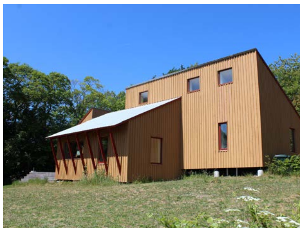
Dette hus er tilpasset omgivelserne i Vallekilde ved at bruge de samme materialer og farver, som forskellige bygninger i området, blandt andet øvelseshuset på billedet til venstre. Arkitekt Arcgency, opført i 2020.