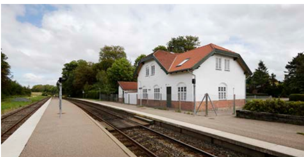
Nationalromantisk stationsbygning i Grevinge fra 1899. En stor del af Odsherredsbanernes bygninger var tegnet af DSB's overarkitekt Heinrich Wenck ligesom stationerne i hovedstaden.