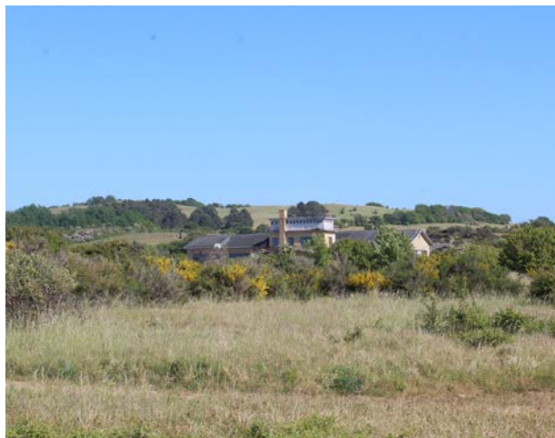
Skamlebæk radiostation nær Fårevejle opført i 1929, gemmer sig i landskabet.

Hvis du placerer et hus på tværs af et terræns naturlige højdekurver, vil huset hurtigt blive et fremmedelement. Hvis du derimod lader huset flugte med terrænets naturlige kurver, vil det oprindelige landskab være lettere at aflæse, og huset vil se mere naturligt ud.