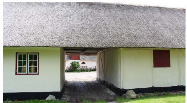
Eksempel på et "ods bindingsværk" - Opført med de materialer som var tilgængelige, som strå, kalk, ler og træ