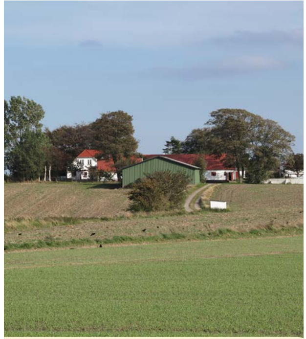
Landbrugsbygning placeret på tværs af vejen, så den fylder mindre i landskabet.