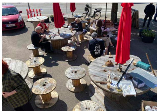
I områdefornyelsesprojektet i Asnæs spiller borgerinddragelse en stor rolle.