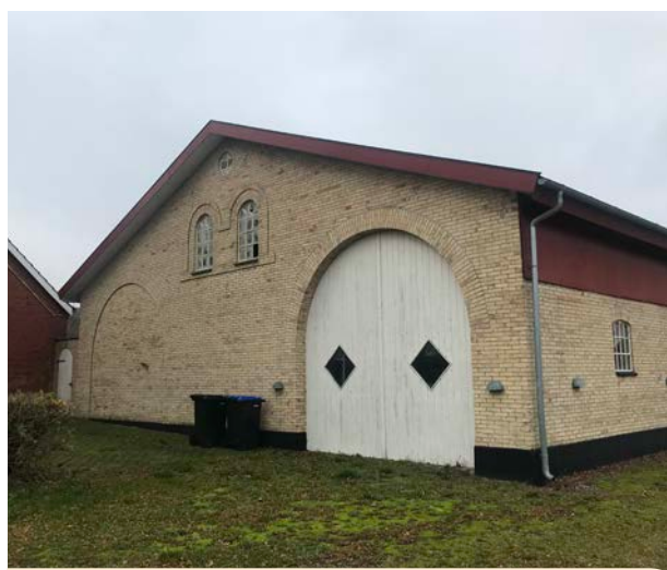
På Stålhøjvej i Asnæs har bygherren besluttet at beholde den gamle gård fra 1900-1923 og lave den om til 17 moderne lejligheder. Det betyder, at vi både sparer på jordens ressourcer, men også at områdets kulturhistorie bliver bevaret.