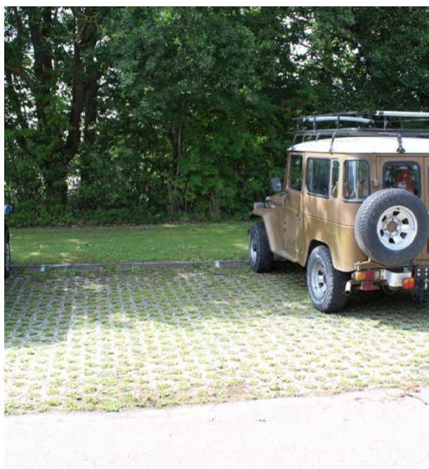
Rådhuset i Højby har permeable belægning på parkeringspladsen, som gør det nemmere for vandet at sive ned og samtidig gør området mere grønt.