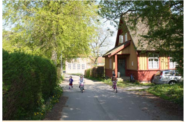
Kulturmiljø i Vallekilde, med mange bevaringsværdige bygninger og smukke gamle træer.

For at bevare den historiske fortælling i et område, som også er med til at skabe stædernes særlige identitet, skal nybyggeri respektere de historiske miljøer og tilstræbe at indpasse sig til området. Det betyder ikke, at det skal være en kopi af den eksisterende bebyggelse, det kan også være en detalje, farve eller form, som tages med i den nye bebyggelse.