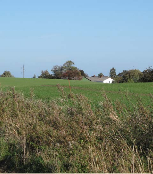
Landbrugsbygning gemt i det åbne land.