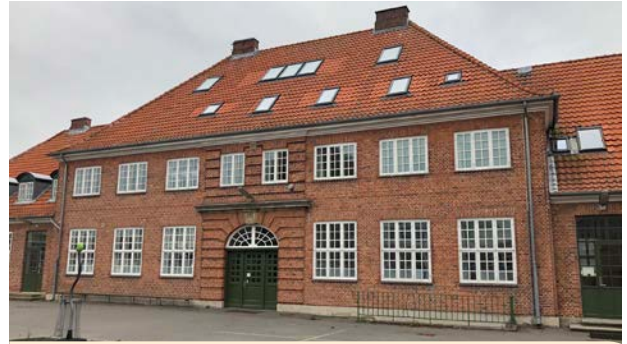
Grundtvigsskolen i Nykøbing opført cirka 1922 i Bedre Byggeskik stil, tegnet af Einar Andersen