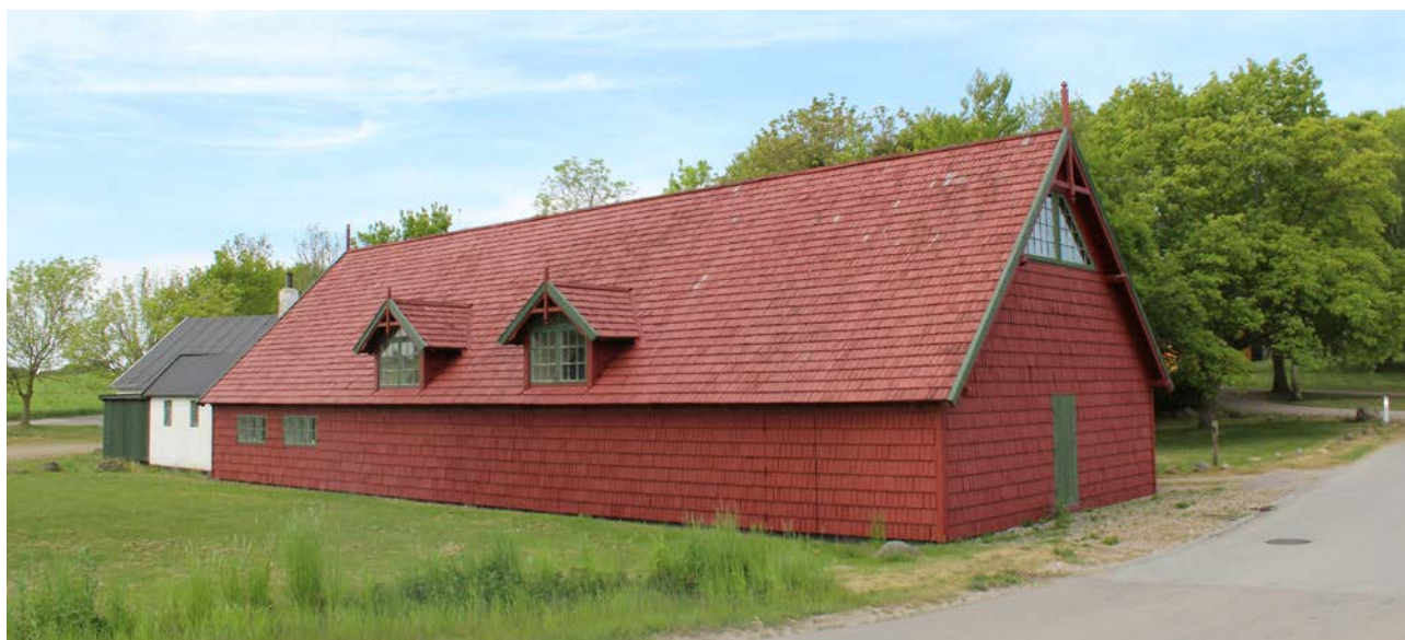
Øvelses- og forsamlingshus fra 1880 i Stenstrup, opført i nationalromantisk stil og beklædt med træspån, tegnet af Andreas Bentsen.

Dette kapitel sætter fokus på Odsherreds kulturarv, og den måde vi kan skabe opmærksomhed på det gennem registrering af bevaringsværdier og kulturmiljøer. Vi fokuserer også på steders identitet og vigtigheden af at tilpasse arkitekturen til dens omgivelserne. Til sidst er der et afsnit om vedligeholdelse af ældre bygninger, fordi det er de bygninger, som er med til at skabe Odsherreds identitet.