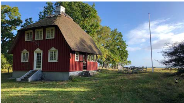
Jagthytte ved Rørvig fra 1918, tegnet af Poul Kofoed.