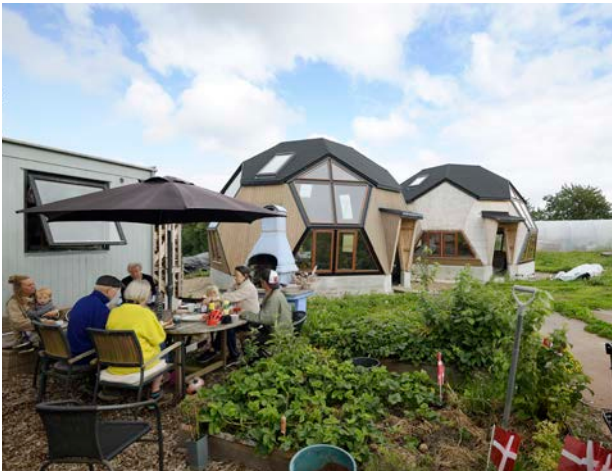
Familien spiser frokost ved siden af deres nybyggede domer i Egeskoven byggefællesskab.

Det betyder blandt andet, at der skal kigges på om fortovene er gode nok, belægninger er lette at gå på, at der er bænke og toiletter nok, samt steder hvor man kan mødes med andre mennesker. Det er vigtigt at være en del af bylivet – hele livet. Derfor er det også vigtigt at der er nok boliger som er egnede til ældre, og at de er placeret klogt – tæt på indkøb, apotek, læge, bus og tog – så man kan komme rundt at nå det hele på en let og tilgængelig måde.