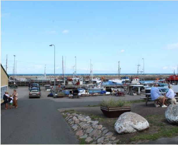
Mange muligheder for at sætte sig på en bænk på Odden havn, gør det muligt for forskellige mennesker at samles.