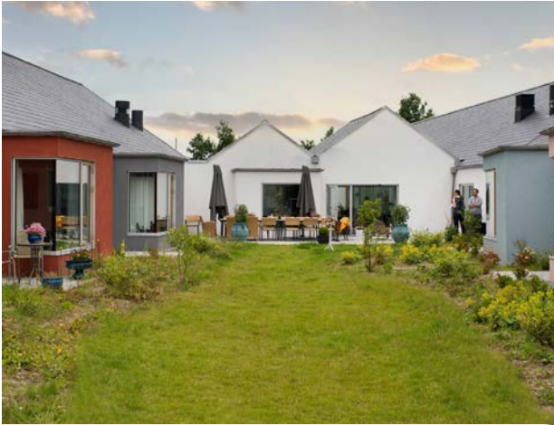
56 plejeboliger og 26 seniorboliger i Himmelev ved Roskilde. Tegnet af RUBOW arkitekter.