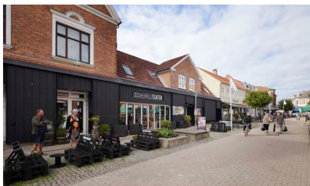
Odsherred Teater fra 2021 er i klar kontrast til den historiske bygning på Algade. Arkitekter Christensen & Co, Primus Arkitekter og STED.