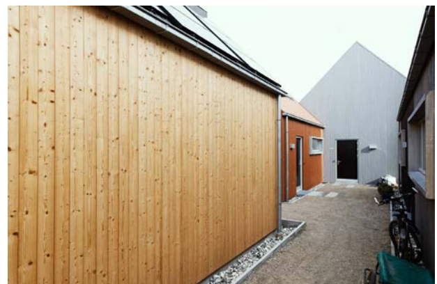
Andelssamfundet Hjortshøj i Aarhus med både ejer-, leje- og andelsboliger. Den første boliggruppe blev bygget i 1992. Der bor nu 300 mennesker i 8 forskellige bogrupper.