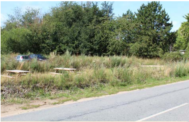
Eksempler på parkeringspladser, som er gemt her hos Tir bageri på Gniben, Sjællands Odde.

Biler og parkeringspladser fylder meget i Odsherred. Det er helt naturligt, og det er vigtigt, at alle kan transportere sig til de større byer og til aktiviteter både i og uden for kommunen. Samtidig er der et stort ønske fra både beboere og fritidsborgere, at biler og parkering fylder mindre i gadebilledet.