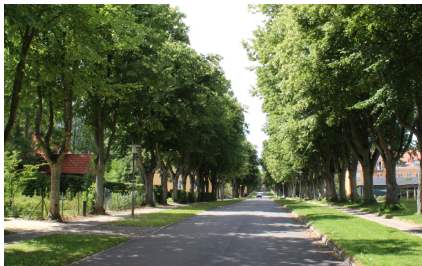
Lindeallé og Annebergparken i Nykøbing med karakteristisk beplantning.

i det åbne land, som både skaber markeringer af markernes afslutninger, og skaber gode levesteder og overgange for dyrelivet. Det skal vi passe på og underbygge i fremtiden.