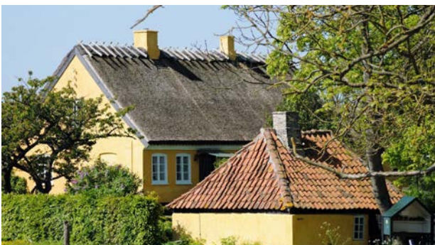
Stråttækt længehus fra 1800 og den gamle smedje i Nakke landsby.