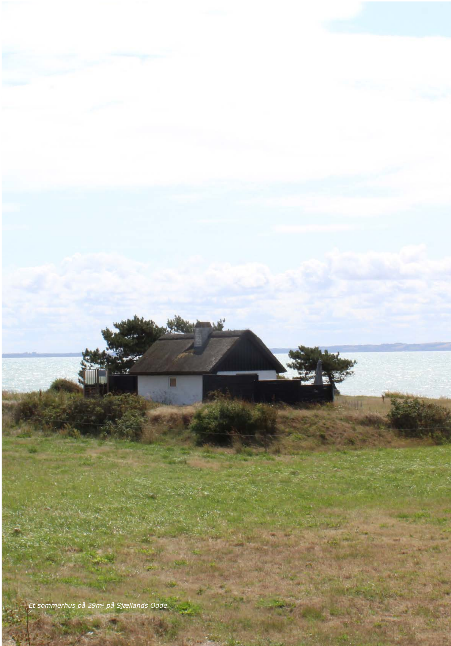
Et sommerhus på 29m 2 på Sjællands Odde.