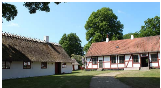
Præstegård i Egebjerg fra 1776. "Ods" bindingsværk til venstre, vestsjællandsk bindingsværk til højre