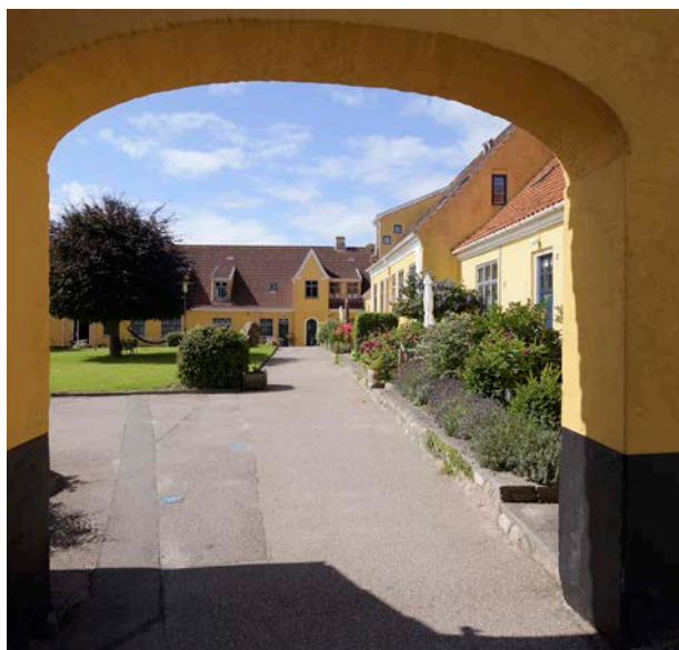
Den gamle bymidte i Nykøbing er ikke SAVE-registeret endnu.