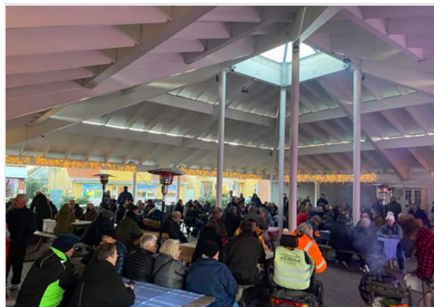
Torvehallen på hovedgaden i Vig er skabt af borgerne selv.

Det vil Odsherred Kommune arbejde med igennem forskellige indsatser. Det starter selvfølgelig her med arkitekturpolitikken. Derudover vil Odsherred Kommune forbedre formidlingen af arkitekturens betydning, når der arbejdes med udviklingsprojekter, kommuneplan og lokalplaner – og skabe en forståelse for, hvor vigtigt det er at deltage i den offentlige proces. Indsatserne er beskrevet yderligere i handleplanen til arkitekturpolitikken.