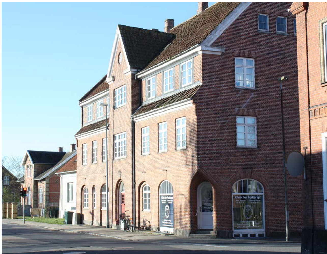
3,5 etagers byvilla tæt på stationen i Nykøbing, tegnet i 1916 af Einar Andersen. Husene ved siden af er revet ned, for at gøre plads til parkeringspladser og et supermarked i ét plan.

Mørke overflader absorberer solens stråler (lav albedo).