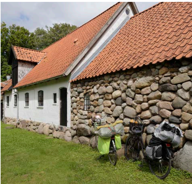
Det skal være nemmere at cykle og gå en tur i stedet for at tage bilen.

Derfor skal trafikken tænkes anderledes, fx med ensretninger af nogle gader, flere bilfrie gader. Det kan være en mulighed at se på midlertidige parkeringspladser – for eksempel i sommersæsonen, hvor mange turister gerne vil køre ture i Odsherred, eller på om der kan laves grønnere parkeringspladser, som bliver forskønnet af træer og en belægning, der giver plads til naturen.