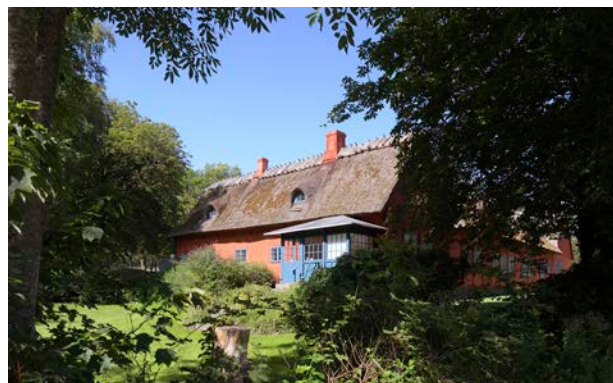
Den røde gård i Vindekilde, som er fredet, er opført med de materialer som var tilgængelige som strå, kalk, ler og træ.

Vi skal værne om den historiske fortælling i vores byggede miljø ved at sikre gamle huse mod nedrivning og udslettelse.