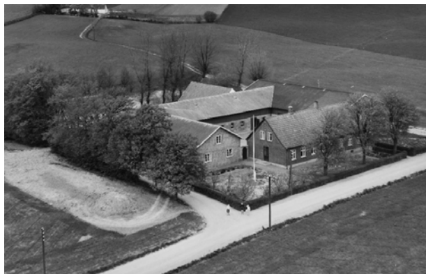
Stålhøjvej i Asnæs bygget omkring 1900, foto ca. 1953.

Målsætning: At fremme brug af materialer, der patinerer smukt og kan genbruges og genanvendes