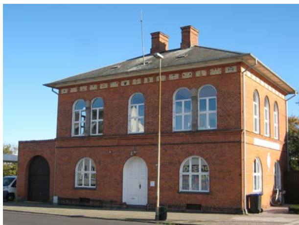
Den Tekniske Skole i Nykøbing anno 2023, en del af Odsherreds kulturarv.