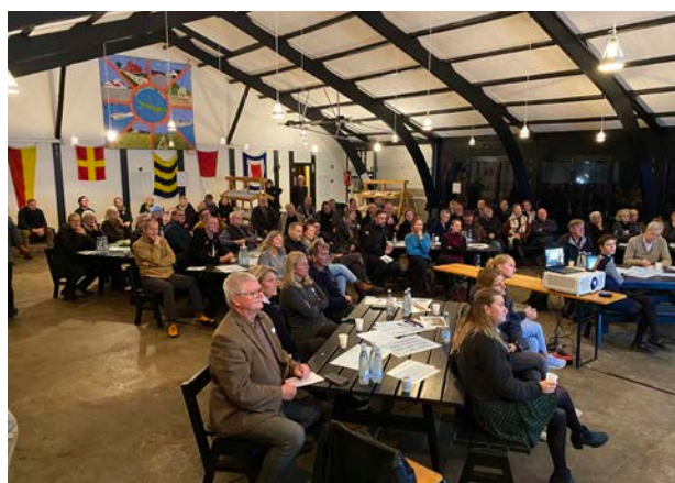
Inspirationsmøde og workshop for arkitekturpolitik i 2023 på Sjællands Odde, præsentation af Jan Gehl.