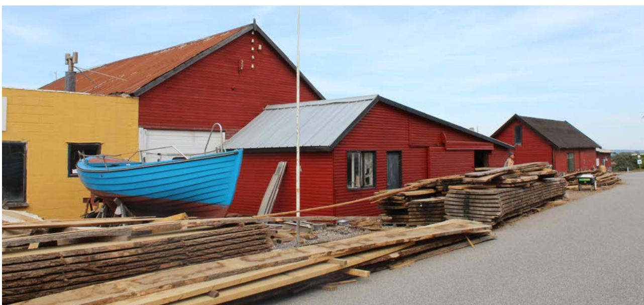
Bådværft på Odden havn, som har en særlig identitet med sine små fiskehytter og træværkstedet.