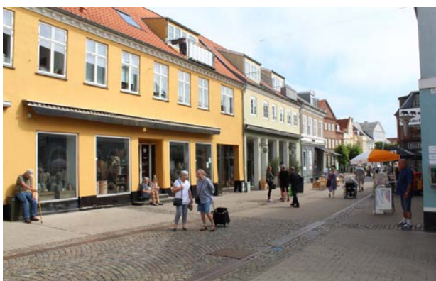
Mennesker tiltrækker mennesker, på Algade i Nykøbing.

Målsætning: At fremme en god dialog med bygherre om arkitektonisk kvalitet så tidligt som muligt i planprocessen