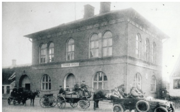
Den Tekniske Skole i Nykøbing cirka 1918.

Fredede bygninger er omfattet af en meget mere restriktiv administrationspraksis, der administreres af Slots- og Kulturstyrelsen.