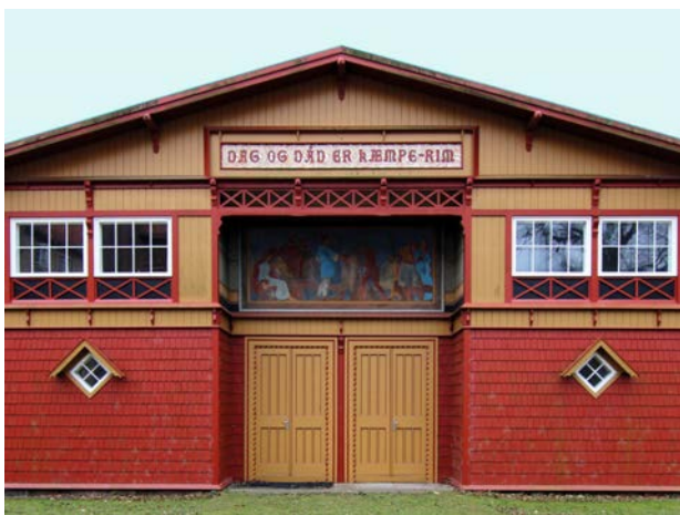
Martin Nyrops øvelseshus i Vallekilde fra 1884. Huset er forsynet med dekorationer og ornamentik - muligvis hentet fra vikingerne, for at slå på forbindelsen til den oldnordiske fortid.