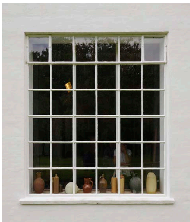
Et vindue i Museum Malergården i Plejerup, som har bevaringsværdi 2.