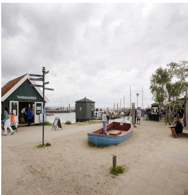
På Rørvig havn er der forskellige aktiviteter og funktioner som tiltrækker mange forskellige mennesker.