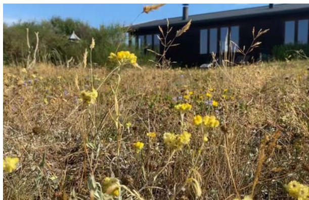
Biodiversitet på en sommerhusgrund.

En af de ting man kan gøre, er at begrænse den mængde fast belægning, man etablerer på grunden. En tæt belægningsgrad omkring en bygning, hindrer nedsivning og medfører derfor mere regnvand i kloaker mv.