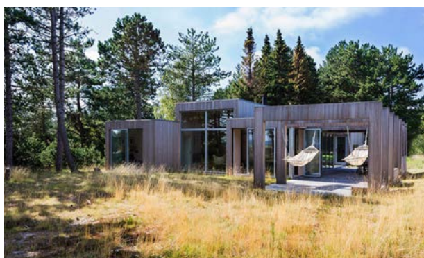
Sommerhus i Rørvig, tegnet af Lotte Elkiær.