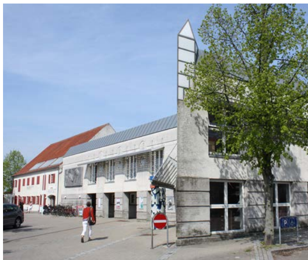
Biblioteket i Nykøbing fra 1989 er i klar kontrast til den historiske bygning ved siden af. Tegnet af arkitektfirmaet Dissing og Weitling.

Målsætning: At lægge vægt på en helhedsvirkning med omgivende gademiljøer og landsbymiljøer og respektere steders særlige identitet