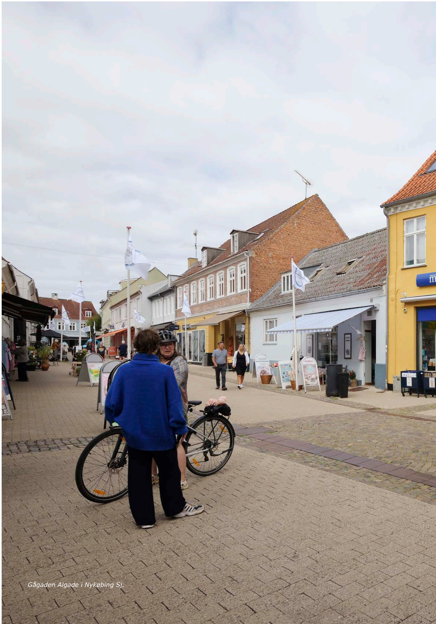
Gågaden Algade i Nykøbing Sj.