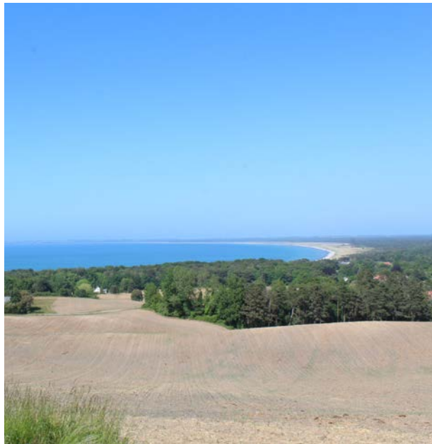
Udsigten over Sejrøbugten fra Veddingevej.

I dette kapitel sætter vi fokus på Odsherreds landskab og miljø. Først og fremmest har vi fokus på genbrug og cirkularitet i byggeriet. Vi sætter fokus på, hvordan vi skaber arkitektur, som spiller sammen med landskabet, og hvordan vi skal sikre bebyggelse af god arkitektonisk kvalitet i det åbne land og i sommerhusområderne.