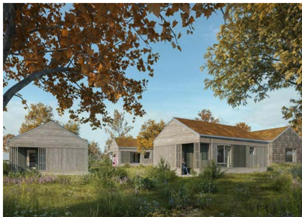
Visualisering af nye tiny-houses ved Egedal behandlingssted for psykisk syge unge i Hørve af Tegnestu Stedse.

Mange undersøgelser viser, at sanseligheden af vores byggede miljø har en stor virkning på os mennesker 10 . For eksempel øges arbejdsglæden på arbejdspladser med mere naturligt lys, og patienter, som har udsigt til grønne arealer, bliver hurtigere udskrevet end patienter, som ikke har 11 .