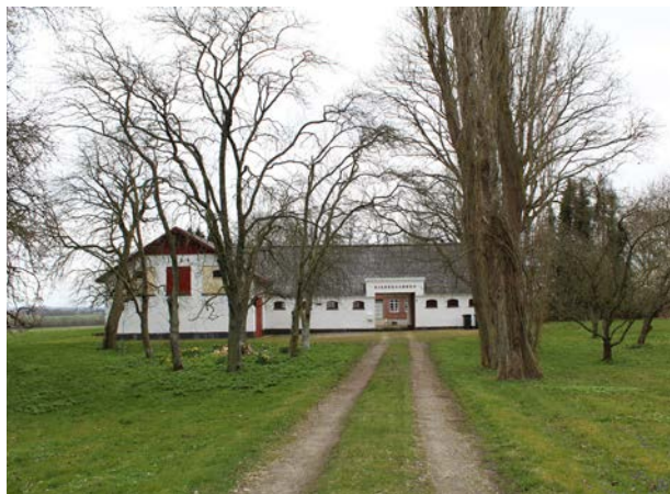
Eksempel på hvidkalket mur med rødmalet træ. Landbrugsbygning i Vallekilde fra 1850.