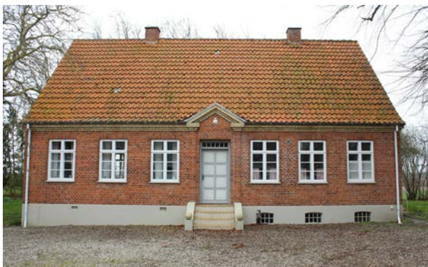
Et bevaringsværdigt hus fra 1924 i Vallekilde, tegnet af Ivar Bentsen, som ikke er registreret som bevaringsværdigt via SAVE-metode.

Odsherred Kommune vil ikke bremse moderniseringen af huse. Fx er det vigtigt at have lys nok i sin bolig, og at huset er tæt og sundt. Vi vil blot sikre, at ændringer sker i respekt for den samlede arkitektoniske helhed og stedsidentiteten, som også er vigtigt for dine naboer og områdets samlede udtryk.