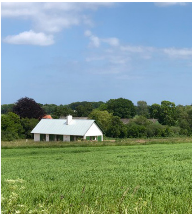
Hus i landskabet på Sydsjælland, tegnet af Mette Lange.