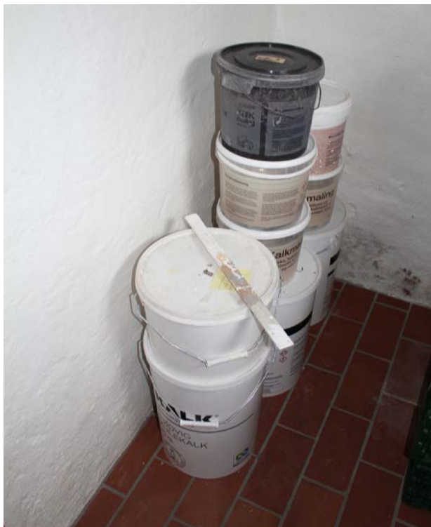
Forskellige materialer som bliver brugt til at vedligeholde et hus i Vallekilde fra før 1960. De er allesammen baseret på kalk.

Målsætning: At tilstræbe at istandsætte og renovere gamle bygninger med de materialer som bygningen er født med