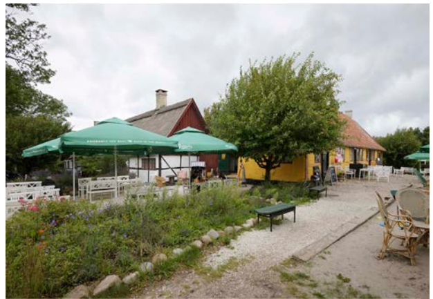
Lodsoldermandsgaarden i Rørvig 1681 er del af den gamle landbys kulturmiljø, som markerer sig med krumme gader og stræder og mange gamle bygninger, hvoraf nogle er flere hundrede år gamle.