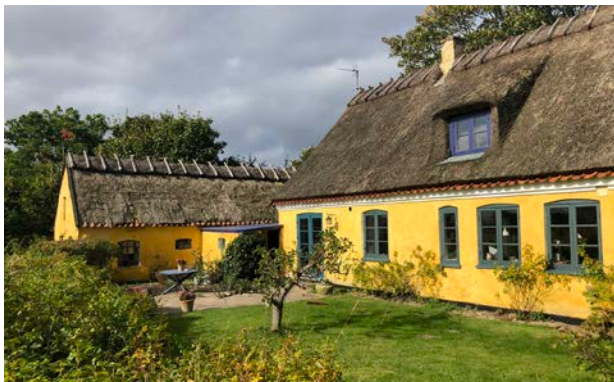
Et bevaringsværdigt længehus fra 1800 i Nakke, optaget i en bevarende lokalplan for Nakke landsby.