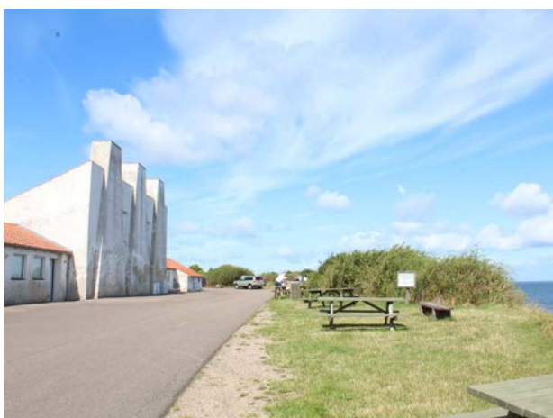
Røgeriet i Havnebyen, tegnet af Arne Jacobsen, er hverken fredet eller SAVE-registeret.

SAVE-registreringer er, sammen med bevarende lokalplaner, de værktøjer, som kommunen kan bruge for at sikre at bygninger bliver bevaret og renoveret med respekt for den arkitektoniske historie. Derfor vil vi arbejde målrettet mod at få registreret bevaringsværdige bygninger, så vi sammen kan passe på vores historie og identitet.