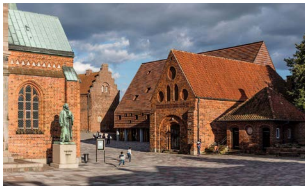
Den nyere bygning tegnet af Tranberg arkitekter er tilpasset Ribes gamle bymidte gennem blandt andet proportioner, materialer og farver.

Er du i tvivl om hvad der gælder for din ejendom, kan du altid booke en tid til et telefonopkald på odsherred.dk/bestiltid