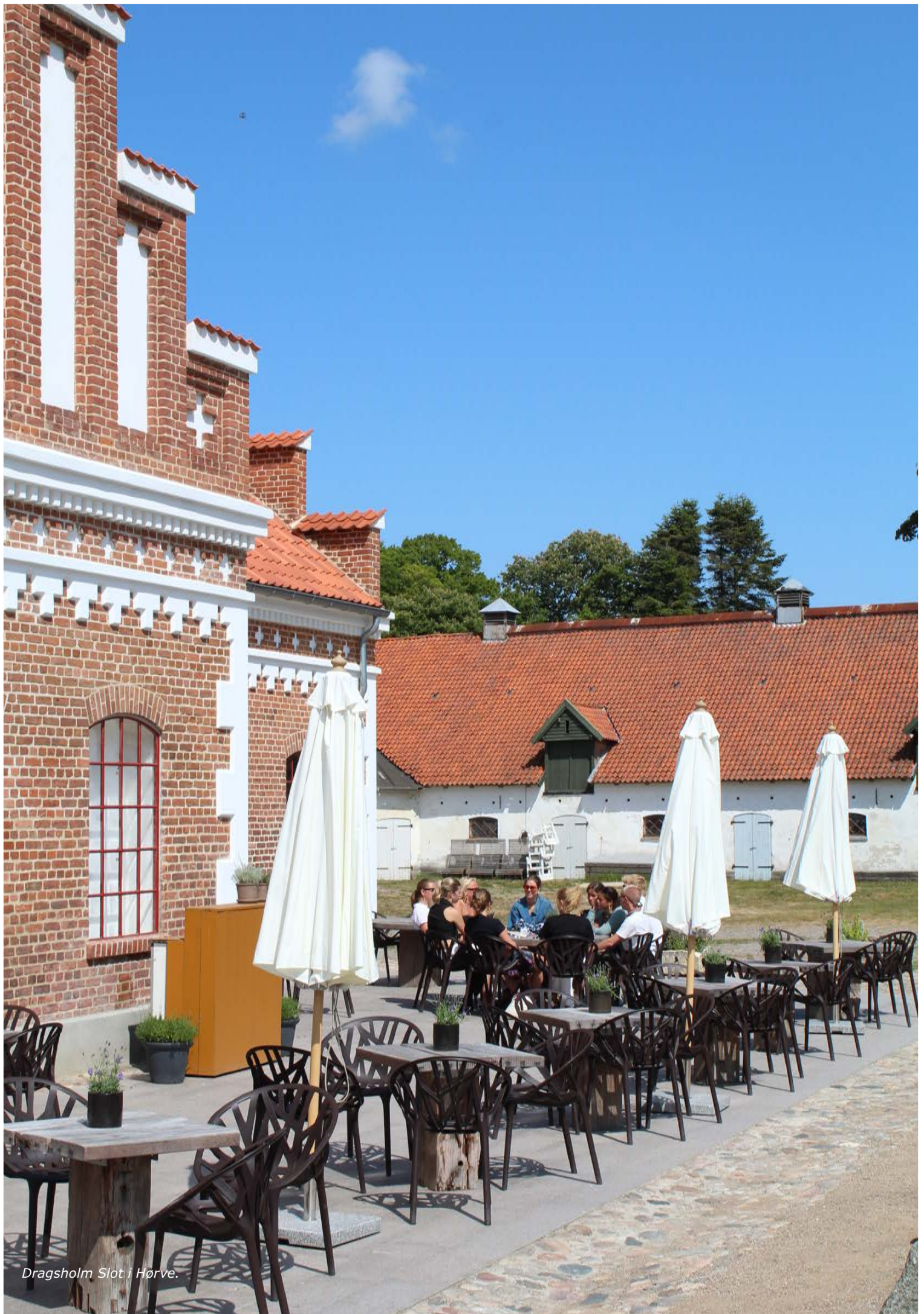
Dragsholm Slot i Hørve.